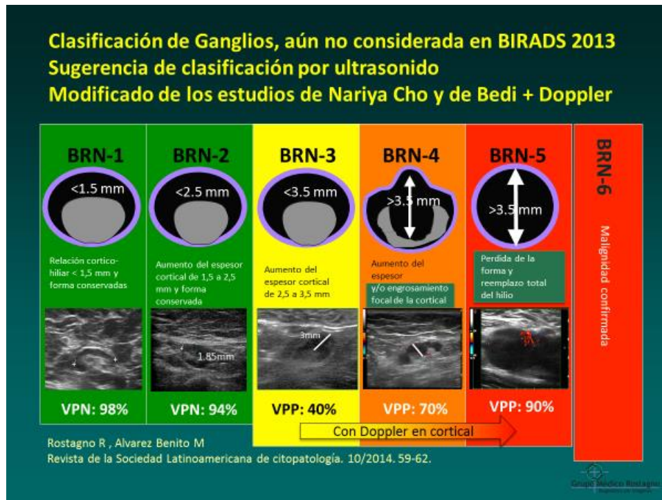
Fig. 2: Cuadro en el cual se observa la propuesta de la clasificación modificada y adaptada. (BRN) (3)